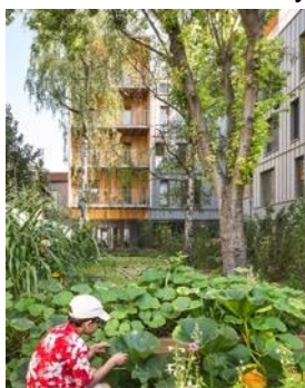
Jardin-Lebour- Lauréat 2020