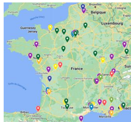
Cartographie des 63 aménagements sélectionnés

Visites ouvertes à la presse sur accréditation