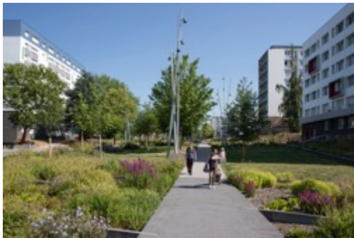
Mons-en-Barœul, Ecoquartier du Nouveau Mons Victoire d'Argent 2016

Source : Etude Unep/IFOP 2016 « Ville en vert, ville en vie : un nouveau modèle de société »