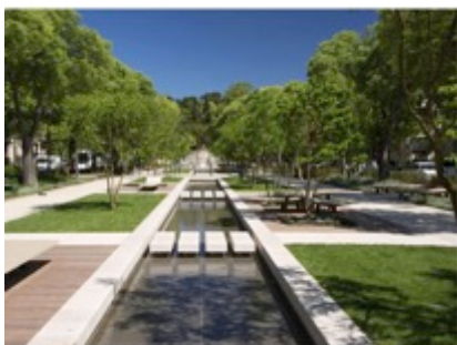
Nîmes, Grand Prix des Victoires du Paysage 2016

LABEL DE RECONNAISSANCE POUR LES COLLECTIVITES. Depuis 2008, le jury du concours national des Victoires du Paysage reconnaît la réussite de politiques d'aménagements urbains, de créations de jardins ou parcs urbains, d'infrastructures, de gestion de zones humides ou encore de rénovation de quartier.